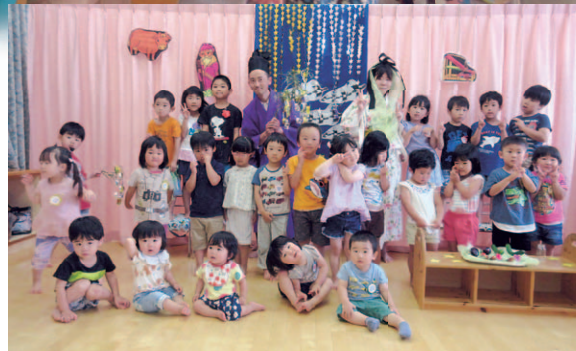
ひこ星さま、おり姫さまと一緒に 保育所七夕会をしました