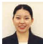
農業 えがわ 江川 かやの

小中学生の皆さんが塗装した顔ハメパネルが工房へ帰ってきました。とても色とりどりでかわいい仕上がりになりました。あとは自立するように調整するのみです。完成をお楽しみに！