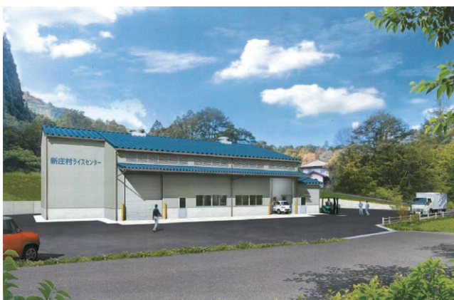
新庄村ライスセンター完成イメージ図

村としては、今後も生産流通加工の一貫体制の継続強化に向け、さらなる政策の取り組みを検討していきたいと考えています。