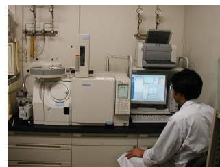
GC/MSによる農薬等類の測定