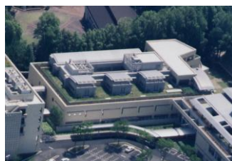
委託水質検査機関：(財)岡山県健康づくり財団

さらに、精度管理については機関内での精度管理の評価試験を行わせるとともに外部が行う精度管理の評価試験を受けさせ、その結果が「不満足」又は「質疑あり」とされるZ値の絶対値が2を超えないよう、精度のよい測定を行わせるなど信頼性の保証に努めています。