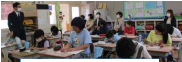
3・4年生は国語 漢字の組み立ての学習 しっかり考え、よくノートを書いていました。