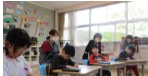
1年生は「はじめての参観日」国語でひらがなの学習をみてもらいました。