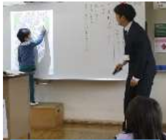
2年生は国語前に出て自分の考えを発表しています。