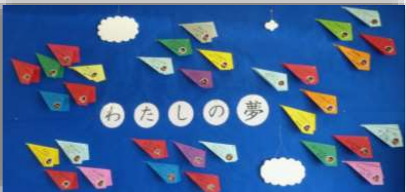
「夢」実現のため、豊かな心、元気な体力、確かな学力を伸ばそう！

児童玄関に、一人ずつの「わたしの夢」を紙飛行機に書いて顔写真と共に掲示しています。 大工さん、ピアニスト、宇宙飛行士、先生、科学者、カフェの店員など、夢は一人ひとり違います。「夢」に近づくために、小学校でしっかりと友達と一緒に学び、遊び、運動をして欲しいと思います。 子どもたちは教科の勉強だけでなく、行事、総合的な学習の時間での体験学習、休み時間の友達との関わりの中で、しっかりと学び、成長しました。