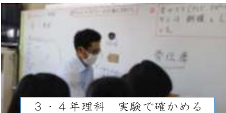
3・4年理科 実験で確かめる

6月17日(土)の参観日には、授業参観、学級懇談に多数出席いただき、ありがとうございます。 1・2年生は学活、3・4年生は理科、5・6年生は学活の授業でした。 少し緊張気味の子もいましたが、頑張って学習している姿を見ていただけたと思います。