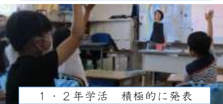
1・2年学活 積極的に発表