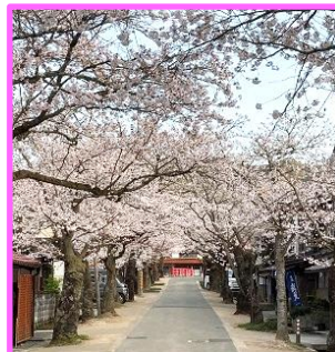
咲き誇るがいせん桜

7年生の入学を祝うかのようにがいせん桜が満開になりました。11日(土)にはがいせん桜プロレス、12日(日)にはがいせん桜祭も催され、新庄村の春らしい日々が続いています。