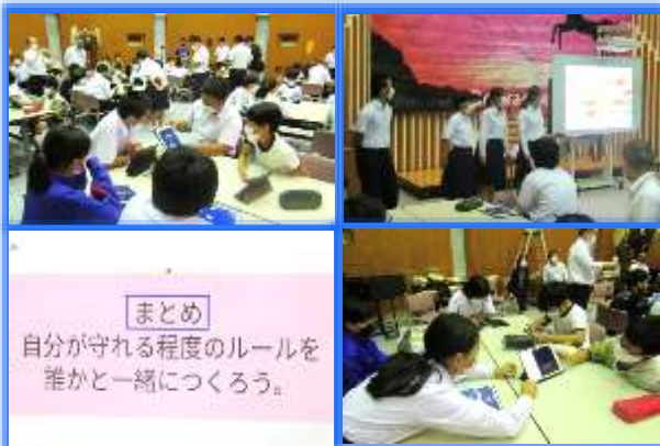
まとめ 自分を守る程度のルールを誰かと一緒につくろう。

授業では、遅い時間に友達から届いたラインに相手の気分を害さずに長引く話を終わらせる言葉を班ごとに考えたりしました。実際に経験もあるのか生徒は、自分のこととしてとらえやすかったようで、慎重に言葉を選びながら考えることができたようです。次のような意見が出ていました。 ☆ごめん、明日も早いからもう寝る。おやすみ。 ☆ぼくはもう寝るから、明日学校で話そう。 今回の学習を通して、スマホやネットの使用時間や方法について改めて考えるよいきっかけになったと思います。ご家庭でもルールについて話し合っていたらいいと思います。