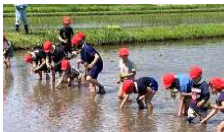
17日(火)には、晴天の下、小学生が田植えを行いました

令和4年度がスタートして、1か月半が経ちました。1年生も学校生活に慣れ、学習部活動・学校行事等に張り切っ取り組んでいます。17日、18日には中学校に入ってはじめての中間テスト(5教科)に臨みました。結果はどうでしたでしょうか。結果に一喜一憂するのではなく、日頃の授業の取組、家庭学習(予習・復習や宿題)の取組を振り返ってみる機会としてほしいと思います。